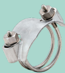
RP-38 ถึง RP-63